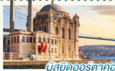
มัสยิดออร์ตาโคย