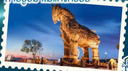
ถ่ายรูปม้าไม้แห่งทรอย